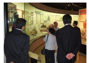
歴史民俗資料館見学