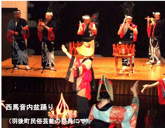
西馬音内盆踊り (羽後町民俗芸能の祭典にて)