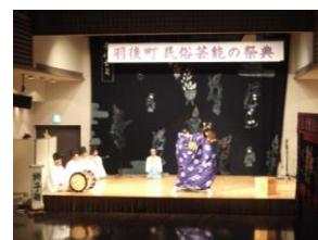
仙道番楽・獅子舞