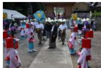
加茂神社での奉納

四国はこんぴらさんのお膝元、香川県仲多度郡まんのう町佐文地区の中央に鎮座する加茂神社。二年に一度、この加茂神社に八月下旬から九月初旬に奉納されるのが、この地域に伝わる「綾子踊」です。この踊は、まず棒持と薙刀持が踊場の中央で口上を述べて棒と薙刀を使って場を清め、次に芸司や拍子の掛け声に合わせて小踊、大踊、側踊の組が並んで踊ります。曲目には、水の踊、四国踊、綾子踊、忍びの踊など十二曲があり、それぞれの小唄に合わせて踊ります。