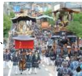
村上祭の屋台行事 (傘鉾と屋台の巡行)

村上城下で培われてきた木工や漆工等の職人技術で作られた屋台は城下町村上の文化遺産であり、各町の人々によって大切に受け継がれています。